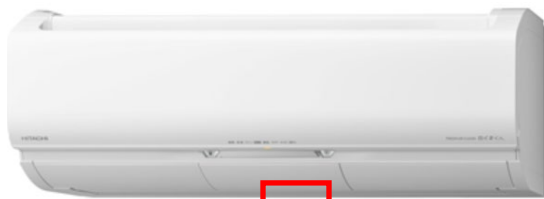
[室内ユニット底面]