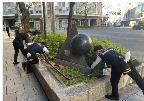
京都府 エディオン京都四条河原町店