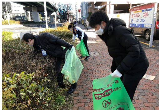
愛知県 エディオン名古屋本店