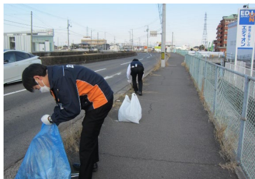
香川県 エディオンゆめタウン丸亀北店