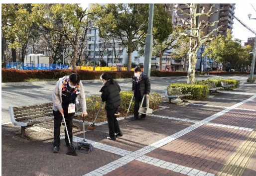
広島県 エディオン呉本店