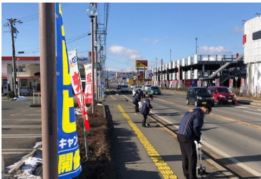
長野県 エディオン長野青木島店