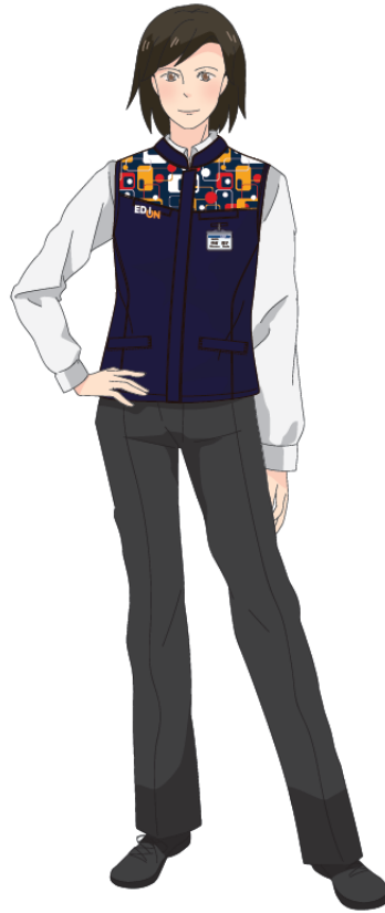
女性用 (パンツスタイル)