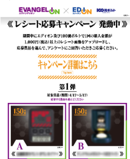
キャンペーン応募画面イメージ

キャンペーン期間中、エディオングループ直営店（エディオン・100満ボルト）で購入金額1,000円（税込）以上のレシートを撮影し、LINE公式アカウントに送信いただくと、抽選で豪華な「エヴァンゲリオン」コラボ家電をプレゼントします。キャンペーンは4月17日（金）～7月31日（金）までの期間に3回実施。何度でもご応募いただけます。 ※ご応募には、「エディオン」もしくは「100満ボルト」のLINE公式アカウントで友だち登録をしていただく必要があります。